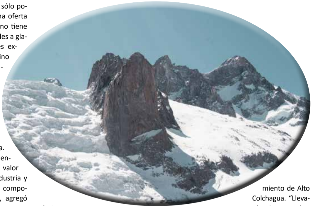
miento de Alto Colchagua. "Llevamos mucho tiempo trabajando en este proyecto colaborativamente, para que los turistas disfruten de la tranquilidad que entregan los glaciares, termas y ro-